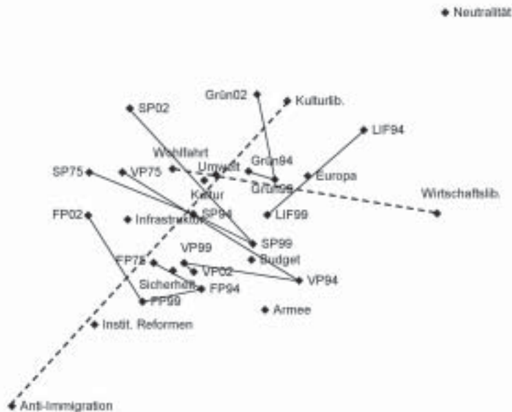
Abbildung 2: Thematische Positionierung der Parteien bei den vier untersuchten Wahlen (Ergebnisse der gewichteten multidimensionalen Skalierung)

Anmerkung: „Budget“ steht aufgrund von Platzgründen für die Themenkategorie „Budget und Steuern“, „Wohlfahrt“ für „Wohlfahrtsstaat“, „Kultur“ für „Wissenschaft und Kultur“. Die übrigen Kategorien entsprechen den im Text erwähnten. „SPÖ02“ steht für die Position der SPÖ bei der Nationalratswahl 2002.